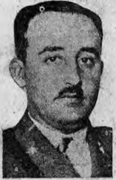
NOBRADO JEFE DEL GOBIERNO ESPAÑOL EL GENERAL FRANCO

Es enorme la confusión que reina en la capital, que se apresta a la defensa En los frentes del norte es inusitada la actividad de las flotas aéreas de ambos bandos Cuatrocientos kilómetros, de frente perfectamente consolidado rodea Madrid El gobierno de Largo Caballero ha perdido toda autoridad, dicese desde Londres Sangrientos combates se están librando en el frente Bilbao-Santander